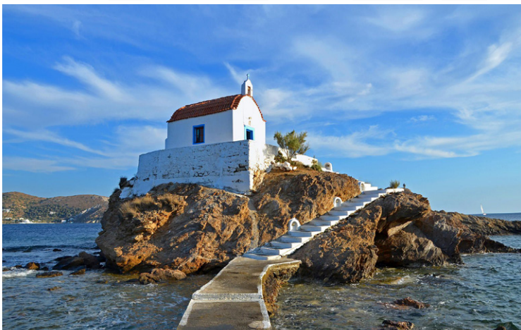
Λέρος - Άγιος Ισίδωρος

Μετά το πρωινό στο ξενοδοχείο μας, θα αναχωρήσουμε για τη βόρεια πλευρά της Λέρου, κατευθυνόμενοι προς την περιοχή της Κιουράς. Θα επισκεφθούμε το εκκλησάκι της Αγίας Ματρώνας - Κιουράς , όπου ξεχωρίζουν οι τοιχογραφίες που φιλοτέχνησαν πολιτικοί εξόριστοι κατά την περίοδο της δικτατορίας, προσδίδοντας στον χώρο έναν ξεχωριστό ιστορικό και συμβολικό χαρακτήρα. Συνεχίζοντας, θα μεταφερθούμε στα Αλινδα , όπου θα περιηγηθούμε εξωτερικά τον Πύργο Μπελλένη , ένα από τα πιο χαρακτηριστικά αρχιτεκτονικά μνημεία του νησιού. Εν συνέχεια, θα επισκεφθούμε ένα από τα πιο εμβληματικά και φωτογενή εκκλησάκια του νησιού, τον Άγιο Ισίδωρο . Το γραφικό αυτό εκκλησάκι είναι χτισμένο πάνω σε ένα μικρό βραχονήσι, το οποίο συνδέεται με τη στεριά μέσω ενός στενού πεζόδρομου, δημιουργώντας ένα μοναδικό σκηνικό που συνδυάζει αρμονικά τη θρησκευτική παράδοση με τη φυσική ομορφιά του τοπίου. Εν συνέχεια, θα απολαύσουμε το μπάνιο μας στην παραλία της Γούρνας και θα ακολουθήσει γεύμα σε παραδοσιακή ψαροταβέρνα . Μεταφορά στο Λακκί , έναν από τους πιο ιδιαίτερους οικισμούς της Λέρου, ο οποίος αποτελεί ένα από τα σημαντικότερα παραδείγματα ιταλικής ρασιοναλιστικής αρχιτεκτονικής στο Αιγαίο, καθώς αναπτύχθηκε κατά την περίοδο της ιταλικής κυριαρχίας στο νησί με τα ξεχωριστά δημόσια κτήρια, τις πλατείες και την πολεοδομική του οργάνωση, όπου θα έχουμε ελεύθερο χρόνο . Απόπλους για τον Πειραιά - ΛΕΡΟΣ - ΠΕΙΡΑΙΑΣ 23.00 - 08.25 (BLUE STAR 2) .