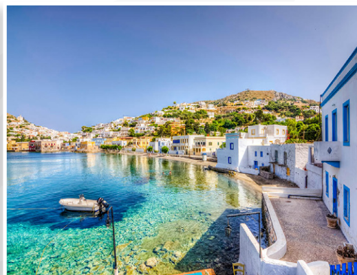
Λέρος - Αγία Μαρίνα