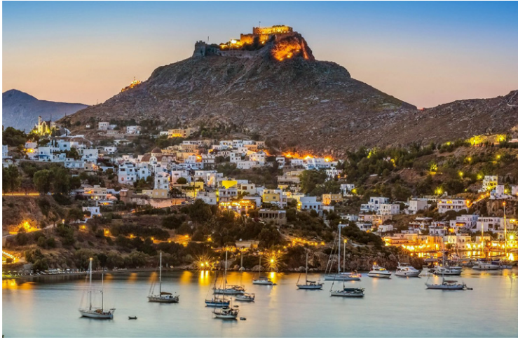
Λέρος - Κάστρο Παντελίου