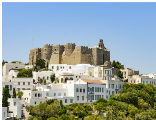
Πάτμος - Χώρα