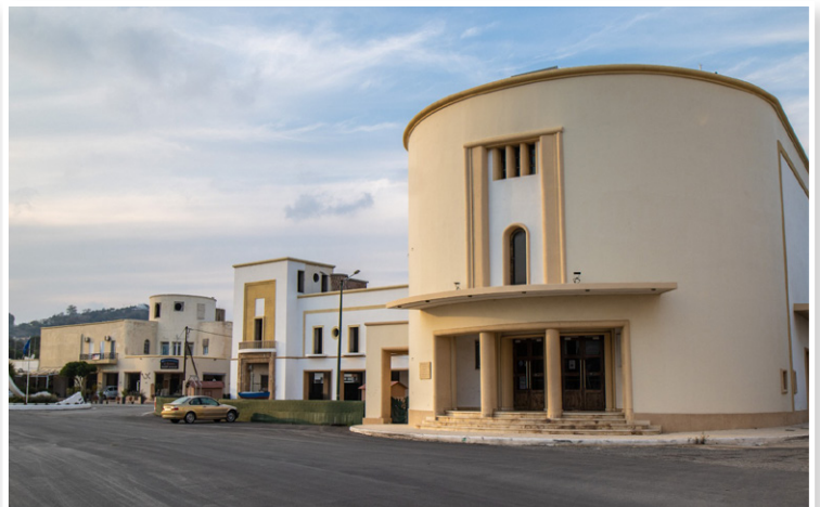
Λέρος - Λακκί