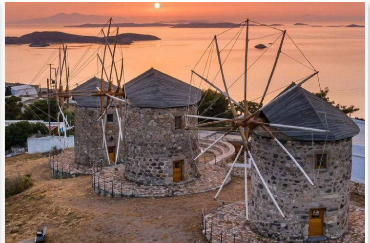
Πάτμος - Ανεμόμυλοι