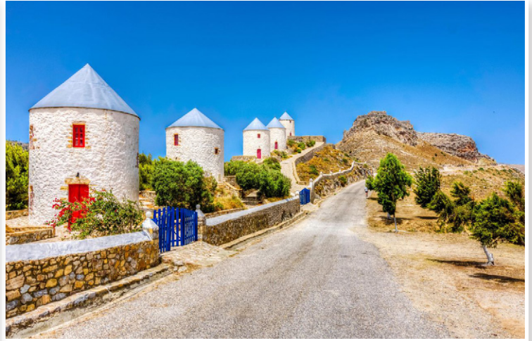
Λέρος - Ανεμόμυλοι