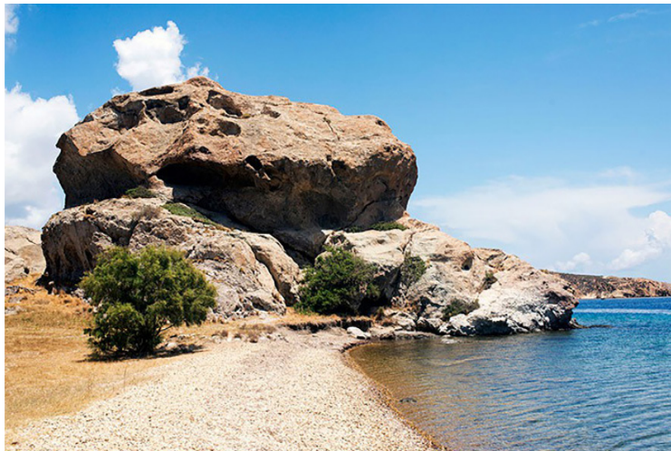
Πάτμος - Βράχος Καλλικατσούς

Η ημέρα μας θα ξεκινήσει με επίσκεψη στην Ιερά Μονή Ευαγγελισμού , την γυναικεία μονή, γνωστή για τη βαθιά της παράδοση και το πλούσιο φιλανθρωπικό της έργο, καθώς και τον Άγιο Αμφιλόχιο , ένα σημαντικό σημείο προσκυνήματος για πολλούς πιστούς, όπου δεσπάζει η παρουσία του τάφου του Οσίου Αμφιλοχίου Μακρή. Εν συνέχεια, καιρού επιτρέποντος, θα κατευθυνθούμε προς το λιμάνι, απ' όπου θα επιβιβαστούμε σε παραδοσιακό σκάφος για μια ξεχωριστή ολήμερη κρουαζιέρα που θα πραγματοποιηθεί κατά μήκος των ακτών του νησιού, προσφέροντας την ευκαιρία να απολαύσουμε το μοναδικό αιγαιοπελαγίτικο τοπίο, όπου θα έχουμε χρόνο για στάσεις και βουτιές σε παρθένες και ανεξερεύνητες παραλίες. Το απόγευμα θα επιστρέψουμε στο ξενοδοχείο για ξεκούραση πριν μεταβούμε στον παραθαλάσσιο οικισμό του Γροίκου , όπου μικρά παραδοσιακά σπίτια, ταβέρνες και καφέ συνθέτουν ένα αυθεντικό νησιωτικό τοπίο. Θα έχουμε την ευκαιρία να θαυμάσουμε τον εντυπωσιακό Βράχο Καλλικατσούς -ένα από τα πιο αναγνωρίσιμα φυσικά τοπία της Πάτμου- και την γνωστή παραλία Πέτρας . Εν συνέχεια θα μεταφερθούμε στην Χώρα της Πάτμου για να απολαύσουμε το ηλιοβασίλεμα από τους ανεμόμυλους , που είναι χτισμένοι σε προνομιακή θέση με πανοραμική θέα προς το Αιγαίο. Η μέρα θα κλείσει με δείπνο σε τοπική ταβέρνα .