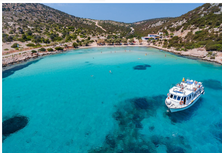
Λειψοί - Πλατύς Γιαλός