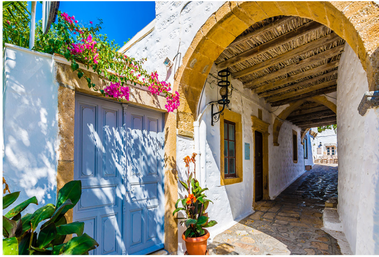
Πάτμος - Χώρα