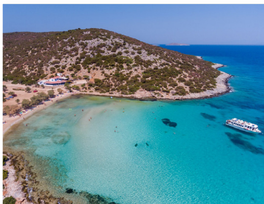
Λειψοί - Πλατύς Γιαλός