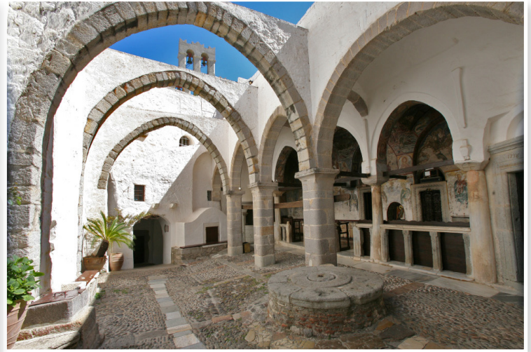
Πάτμος - Ιερά Μονή του Αγίου Ιωάννη του Θεολόγου