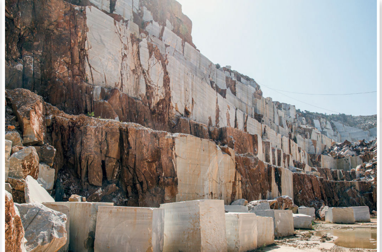
Προκόννησος (Νήσος του Μαρμαρά) - Λατομείο