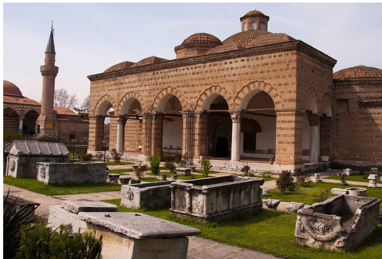
Νίκαια (Iznik) - Ιμαρέτ

αυτοκρατορία, χαρακτηριστικό τεχνικό έργο της εποχής του Ιουστινιανού. Μετάβαση στη Νικομήδεια (Izmit) , μεγαρική αποικία του 8ου αι. π.Χ., η οποία σήμερα δεν διατηρεί ίχνη του μακραίωνου παρελθόντος, και επίσκεψη στο Αρχαιολογικό Μουσείο, μέσα από τα εκθέματα του οποίου διαγράφεται η ιστορία της πόλης και της περιοχής της από την Εποχή του Λίθου ως το τέλος της ρωμαϊκής περιόδου.