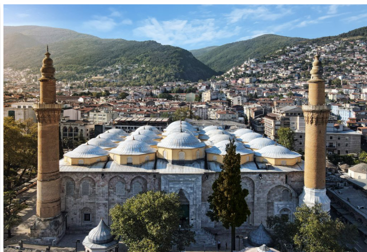
Προύσα (Bursa) - Μεγάλο Τέμενος (Ulu Camii)