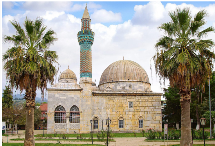
Νίκαια (Iznik) - "Πράσινο" Τέμενος