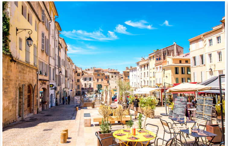
Aix En Provence