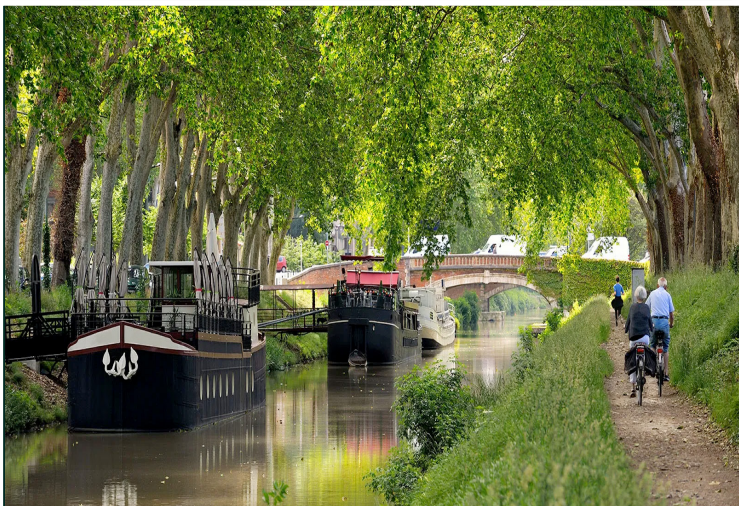
Canal Du Midi

Μετά το πρωινό περιήγηση στην πόλη του Montpellier , διάσημη για την ιατρική της σχολή ήδη από το 14ο αιώνα, τη ζωνρή πνευματική κίνηση, τον κοσμοπολίτικο χαρακτήρα της, οφειλόμενο στις εναλλαγές κυριάρχων και τη συμβίωση Ισπανών, Αράβων της Ιβηρικής, Εβραίων, Γάλλων. Στάσεις στα σημαντικότερα μνημεία και τα χαρακτηριστικά σημεία της πόλης, μεταξύ των οποίων η Place de la Comédie -κέντρο της καθημερινότητας των κατοίκων του Montpellier, όπου η Όπερα (1888) και το μνημείο των Τριών Χαρίτων-, ο ιστορικός πυρήνας ( L' Ecusson ) -με τα γραφικά μεσαιωνικά στενά, τα εντυπωσιακά ιδιωτικά μέγαρα (hôtels particuliers) του 17ου, 18ου και 19ου αι., τις μικρές πλατείες με καφέ και εστιατόρια-, η τυπική για την εποχή του Βασιλέα-Ηλίου Place Royale de Peyrou με τη θριαμβική αψίδα του Λουδοβίκου ΙΔ' (1695), τον πύργο του νερού και το υδραγωγείο, ο φρουριακός όψης καθεδρικός του Αγίου Πέτρου (14ος, 17ος αι.) και η έδρα της περιώνυμης Ιατρικής Σχολής (αρχικώς Μονή Βενεδικτίνων), ο αρχαιότερος βοτανικός κήπος της Γαλλίας ( Jardin des Plantes ) - ιδρυμένος το 1593 στο πλαίσιο λειτουργίας της Ιατρικής Σχολής. Η περιήγηση θα καταλήξει στο περίφημο Musée Fabre , που φιλοξενεί μια από τις μεγαλύτερες συλλογές ζωγραφικής της Γαλλίας, με έργα Φλαμανδών, Ολλανδών, Ιταλών, Γάλλων καλλιτεχνών από το 15ο αι. ως τις ημέρες μας.