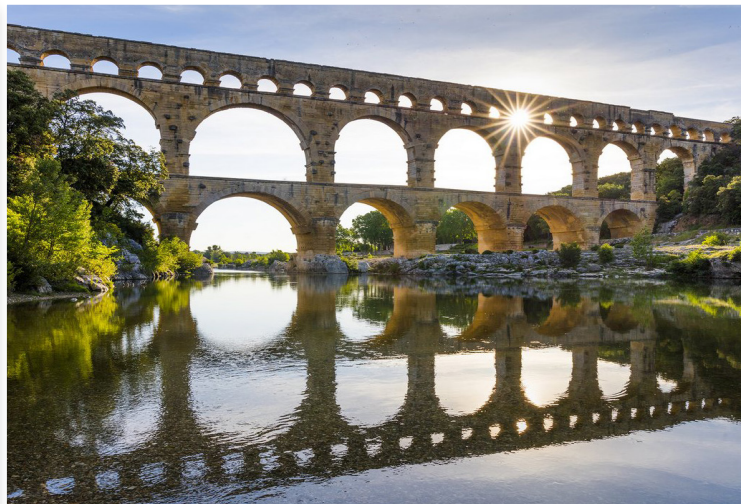
Pont du Gard