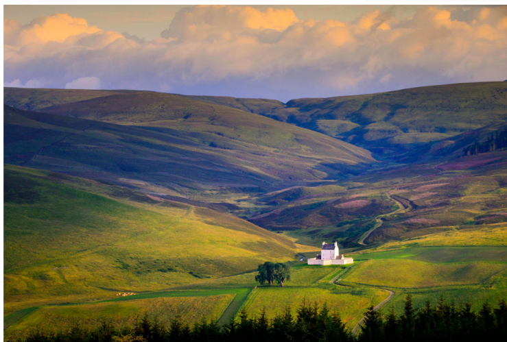
Η περιοχή Speyside