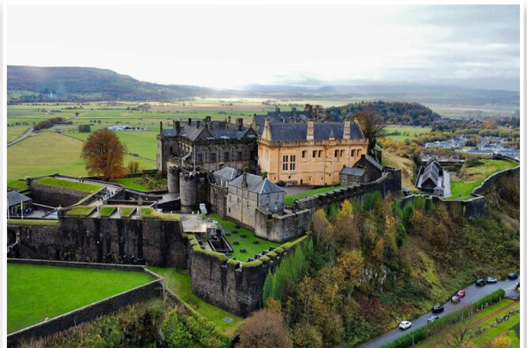
Κάστρο του Stirling