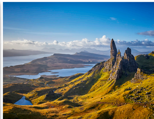
Νήσος Skye - Old Man of Storr