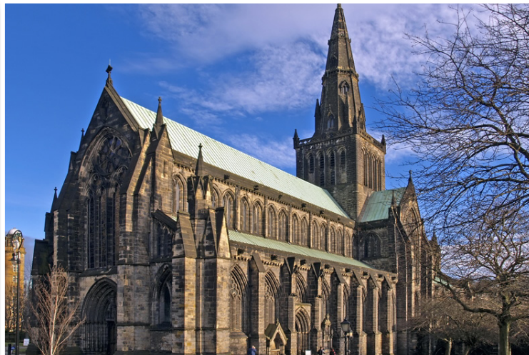
Γλασκώβη - Καθεδρικός Ναός