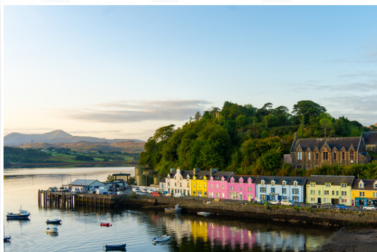
Νήσος Skye - Portree