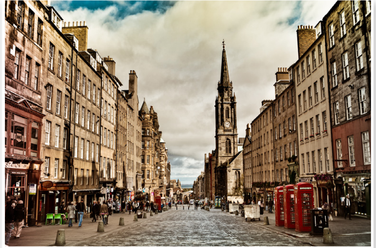
Εδιμβούργο - Royal Mile