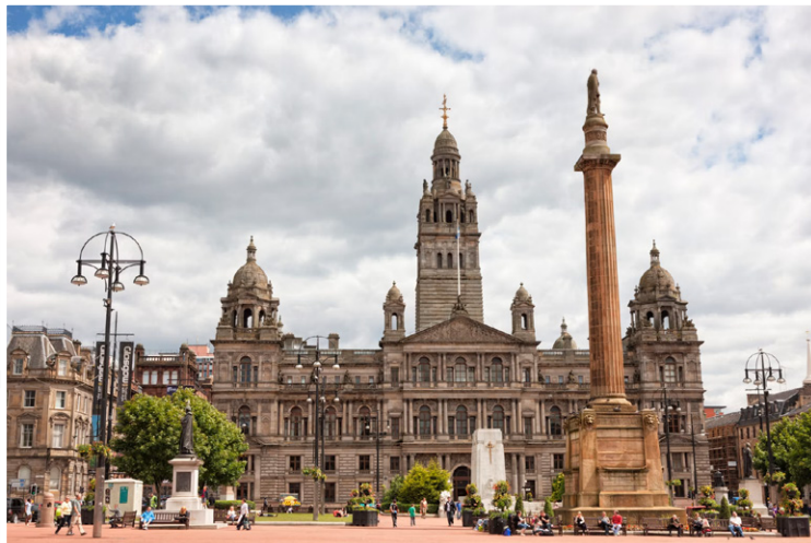
Γλασκώβη - George Square