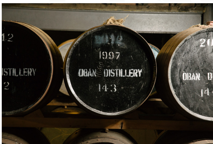
Oban - Αποστακτήριου Whisky

Στη συνέχεια θα φτάσουμε στη Θρυλική κοιλάδα του Glencoe , έναν από τους πιο εντυπωσιακούς φυσικούς τόπους της Σκωτίας αλλά και σημείο με ιδιαίτερη ιστορική σημασία, καθώς συνδέεται με τη δραματική σφαγή της φατρίας των MacDonalδ τον 17ο αιώνα. Το τοπίο με τις απόκρημνες βουνοκορφές, τις ομιχλώδεις πλαγιές και τις αχανείς κοιλάδες θεωρείται από τα ωραιότερα της χώρας. Θα πραγματοποιήσουμε στάση στο περίφημο Three Sisters Viewpoint , από όπου θα απολαύσουμε μία από τις πιο χαρακτηριστικές και φωτογραφημένες εικόνες των Highlands. Το απόγευμα άφιξη στο γραφικό παραθαλάσσιο Oban , τη λεγόμενη «θαλασινή πύλη» των Εβρίδων, χτισμένο αμφιθεατρικά στις ακτές του Ατλαντικού. Η πόλη είναι γνωστή για το λιμάνι της, τη ναυτική της παράδοση και τη χαλαρή ατμόσφαιρα που συνδυάζει τον χαρακτήρα μικρής παραθαλάσσιας πόλης με την κοσμοπολίτικη κίνηση των ταξιδιωτών προς τα νησιά των Εβρίδων. Θα ακολουθήσει ξενάγηση στο ιστορικό Oban Distillery , ένα από τα παλαιότερα και πιο φημισμένα αποστακτήρια whisky της Σκωτίας, όπου θα γνωρίσουμε τη διαδικασία παραγωγής του παραδοσιακού single malt whisky και θα απολαύσουμε δοκιμή εκλεκτών αποσταγμάτων της περιοχής.