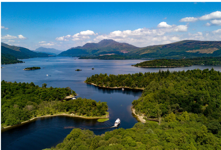
Loch Lomond - Εθνικό Πάρκο Trossachs