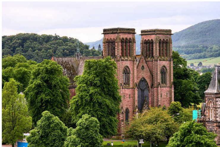
Inverness - Καθεδρικός Ναός