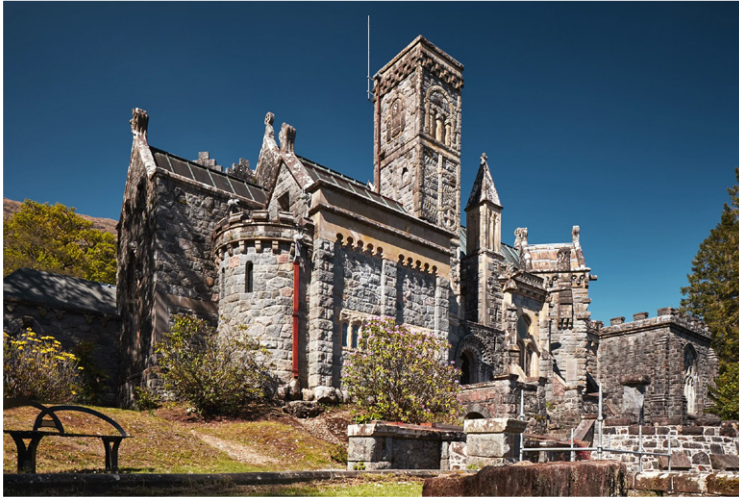
St. Conan's Kirk