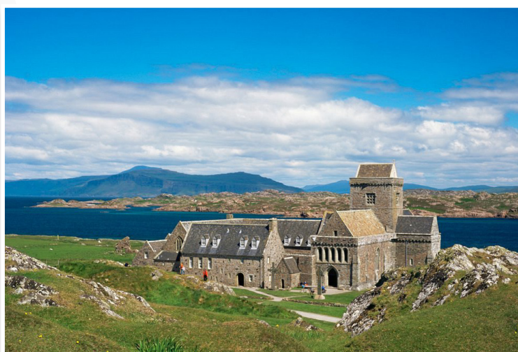
Νησί Mull - Αββαείο της Iona