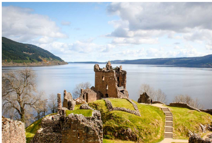
Loch Ness - Κάστρο Urquhart