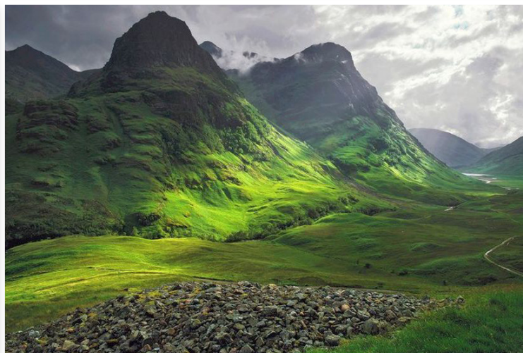
Κοιλάδα Glencoe - Three Sisters

Στη συνέχεια θα φτάσουμε στη Θρυλική κοιλάδα του Glencoe , έναν από τους πιο εντυπωσιακούς φυσικούς τόπους της Σκωτίας αλλά και σημείο με ιδιαίτερη ιστορική σημασία, καθώς συνδέεται με τη δραματική σφαγή της φατρίας των MacDonalδ τον 17ο αιώνα. Το τοπίο με τις απόκρημνες βουνοκορφές, τις ομιχλώδεις πλαγιές και τις αχανείς κοιλάδες θεωρείται από τα ωραιότερα της χώρας. Θα πραγματοποιήσουμε στάση στο περίφημο Three Sisters Viewpoint , από όπου θα απολαύσουμε μία από τις πιο χαρακτηριστικές και φωτογραφημένες εικόνες των Highlands. Το απόγευμα άφιξη στο γραφικό παραθαλάσσιο Oban , τη λεγόμενη «θαλασινή πύλη» των Εβρίδων, χτισμένο αμφιθεατρικά στις ακτές του Ατλαντικού. Η πόλη είναι γνωστή για το λιμάνι της, τη ναυτική της παράδοση και τη χαλαρή ατμόσφαιρα που συνδυάζει τον χαρακτήρα μικρής παραθαλάσσιας πόλης με την κοσμοπολίτικη κίνηση των ταξιδιωτών προς τα νησιά των Εβρίδων. Θα ακολουθήσει ξενάγηση στο ιστορικό Oban Distillery , ένα από τα παλαιότερα και πιο φημισμένα αποστακτήρια whisky της Σκωτίας, όπου θα γνωρίσουμε τη διαδικασία παραγωγής του παραδοσιακού single malt whisky και θα απολαύσουμε δοκιμή εκλεκτών αποσταγμάτων της περιοχής.