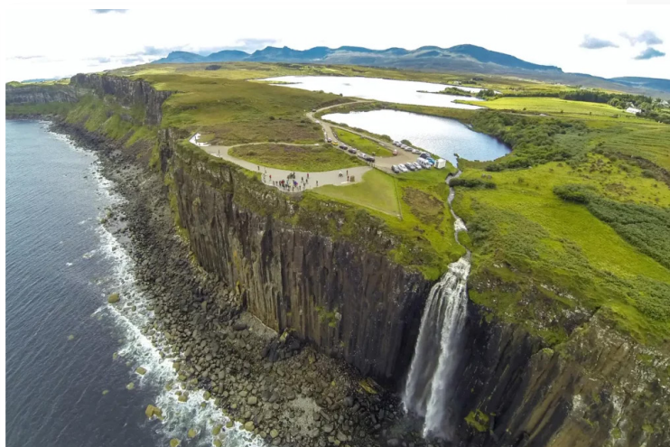
Νήσος Skye - Kilt Rock & καταρράκτης Mealt Falls