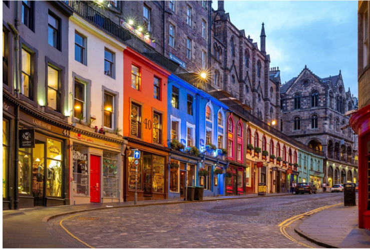
Εδιμβούργο - Victoria Street