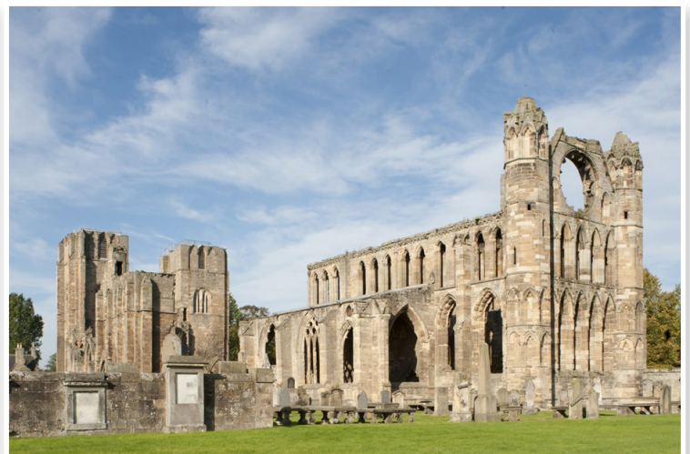
Elgin - Καθεδρικός Ναός