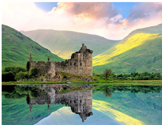
Loch Awe - Κάστρο Kilchurn

28 Σεπτεμβρίου - 08 Οκτωβρίου 2026 (ΗΜΕΡΕΣ 11)