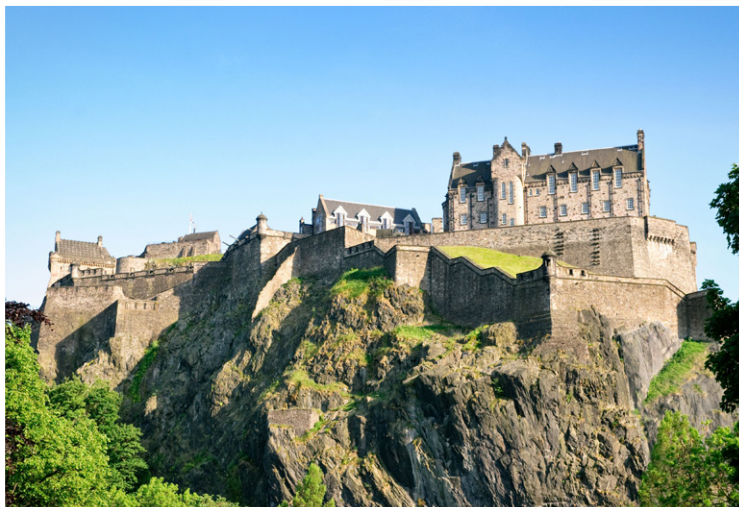
Κάστρο του Εδιμβούργου