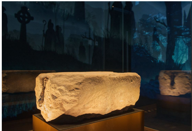
Μουσείο του Perth - Λίθος του Περωμμένου