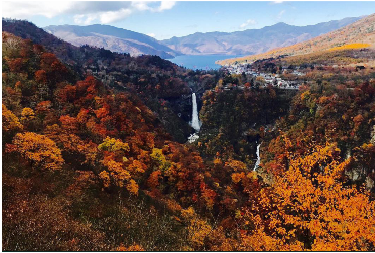
Nikko - Καταρράκτης Kegon

Ημερήσια εκδρομή στο Νικκο , μία από τις ιερότερες και πιο όμορφες περιοχές της Ιαπωνίας, η οποία είναι φωλιασμένη στους πρόποδες των ορεινών περιοχών του Τοτσίκι. Η ξενάγησή μας ξεκινά από το μαυσωλείο Toshogu , τον τάφο του πρώτου Σόγκουν (ανώτερος στρατιωτικός ηγέτης) της τελευταίας και μακροβιότερης κυβέρνησης σαμουράι στην Ιαπωνία, η οποία κυριάρχησε από το 1603 έως το 1867 (ειρηνική περίοδος Edo). Το μαυσωλείο είναι αφιερωμένο στον Tokugawa Ieyasu, ιδρυτή του ομώνυμου σογκουνάτου. Το συγκρότημα είναι ένα περίτεχνο σύμπλεγμα κτηρίων, διακοσμημένο με επιχρυσωμένα ξυλόγλυπτα και πολύχρωμα μοτίβα που συνδυάζουν σιντοϊστικά και βουδιστικά στοιχεία. Δίχως αμφισβήτηση αποτελεί το κορυφαίο μνημείο της περιόδου Έντο. Στη συνέχεια κατευθυνόμαστε προς τα υψίπεδα, όπου απλώνεται η λίμνη Chuzenji , η οποία σχηματίστηκε εξαιτίας της έντονης ηφαιστειακής δραστηριότητας στους πρόποδες του όρους Νάνταϊ. Εδώ θα θαυμάσουμε τον καταρράκτη Kegon , όπου ένας ιαπωνικός θρύλος αναφέρει ότι αποτελεί το μέρος που οι νεαροί Ιάπωνες προτιμούν να βάλουν τέρμα στη ζωή τους. Τα νερά του καταρράκτη πέφτουν θεαματικά από ύψος 97 μέτρων — με δυνατότητα καθόδου μέσω ασανσέρ στο επίπεδο της βάσης του επιβλητικού καταρράκτη. Επιστροφή στο Τόκιο και δείπνο στο ξενοδοχείο.