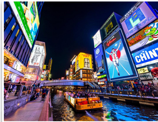
Osaka - Κανάλι Dotonbori

Σχεδιάσαμε ένα πολυδιάστατο ταξίδι 20 ημερών για να γνωρίσουμε σε βάθος τη χώρα του Ανατέλλοντος Ηλίου, μια χώρα βαθιά ποιητική, αυστηρά αισθητική και ασύλληπτα ετερόκλητη, έναν κόσμο αντιθέσεων σε απόλυτη ισορροπία. Η Ιαπωνία ζει σε δύο χρόνους ταυτόχρονα, με το ένα της πόδι βαθιά ριζωμένο στην παράδοση των σαμουράι, των ναών και της ζεν σιωπής και το άλλο να εκτοξεύεται στο μέλλον μέσα από φουτουριστικές πόλεις, τεχνολογία αιχμής και έναν αστικό παλμό που δεν σταματά ποτέ, αποτελώντας ένα από τα πιο συναρπαστικά πολιτισμικά φαινόμενα του πλανήτη. Πρόκειται για ένα πραγματικά πυκνό οδοιπορικό, που διατρέχει το μεγαλύτερο νησί της χώρας, το Χονσού και το νησί Σικόκου από άκρη σε άκρη: από το υπερσύγχρονο Τόκιο και τα γαλήνια τοπία του Φούτζι, μέχρι τα φεουδαρχικά κάστρα, τα ορεινά χωριά των Ιαπωνικών Άλπεων, τους ιερούς τόπους της Νάρα, την ιστορική λουτρόπολη Ματσουγιάμα, την πολυπάθη Χιροσίμα με το ιερό νησί Μιγιατζίμα, το αυτοκρατορικό Κιότο και την υπερσύγχρονη Οσάκα.