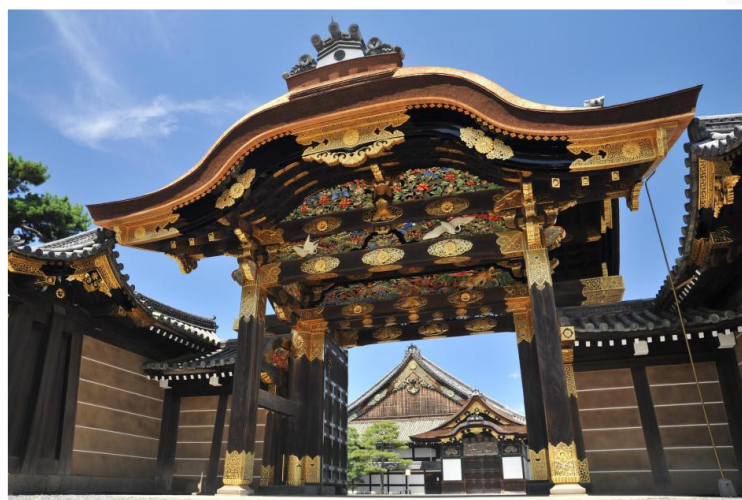
Kyoto - Κάστρο Nijo