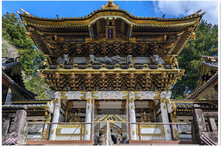
Nikko - Μαυσωλείο Toshogu