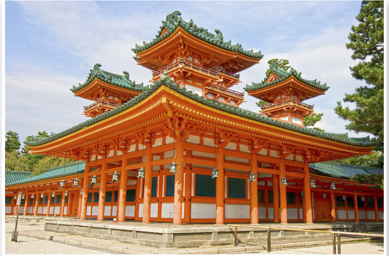
Kyoto - Ιερό Heian