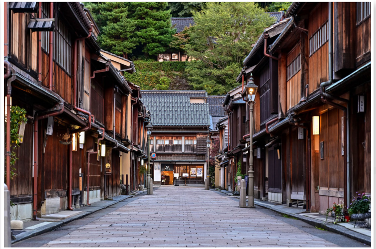
Kanazawa - Higashi Chaya