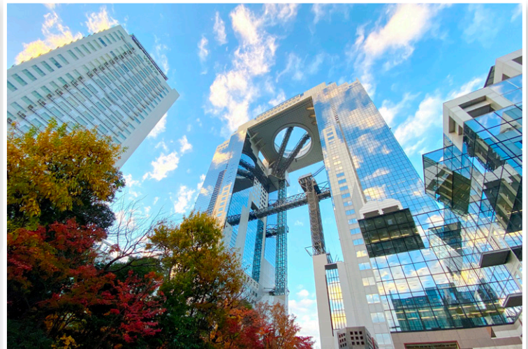
Osaka - Umeda Sky Building