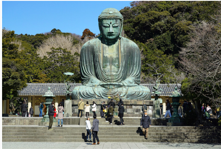
Kamakura - Ο Μεγάλος Βούδας (Daibutsu)