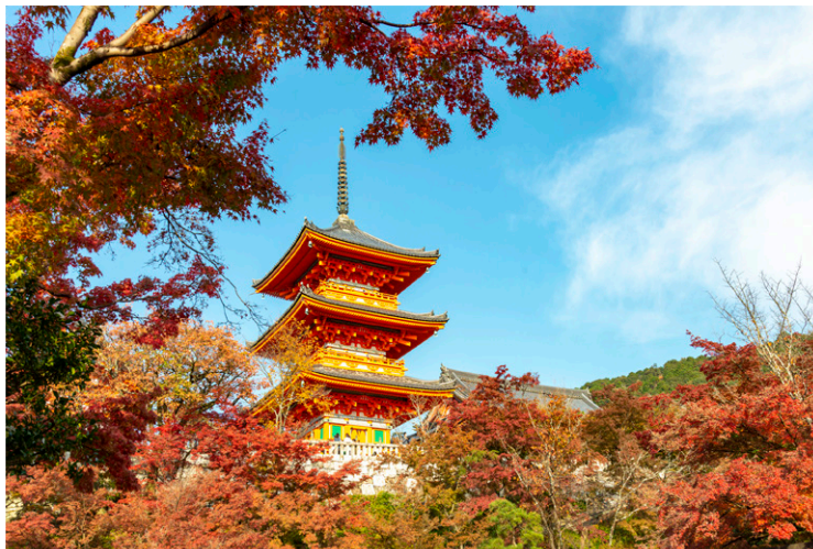
Kyoto - Kiyomizu-dera