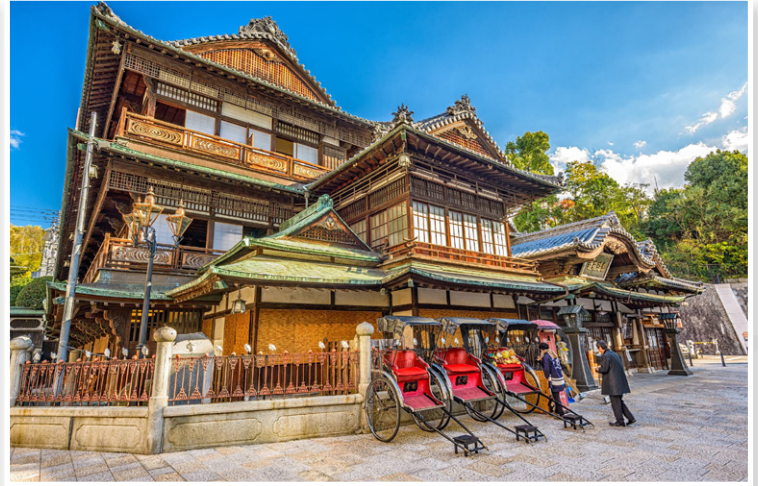
Matsuyama - Dogo Onsen