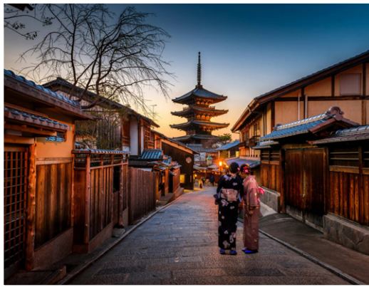
Κυότο - Ιστορικό Κέντρο