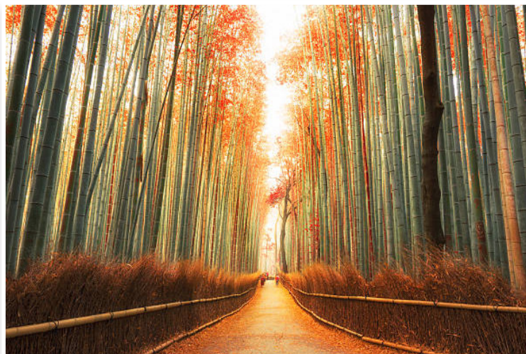
Arashiyama - Δάσος Μπαμπού