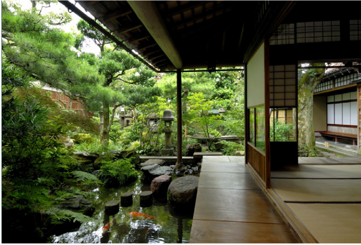
Kanazawa - Οικία Nomura