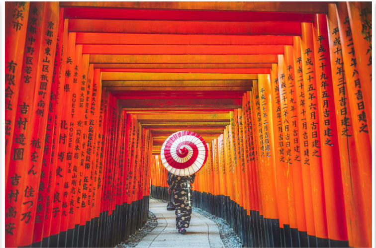
Kyoto - Fushimi Inari Taisha