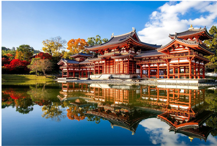
Uji - Ναός Byodoin (Αίθουσα του Φοίνικα)