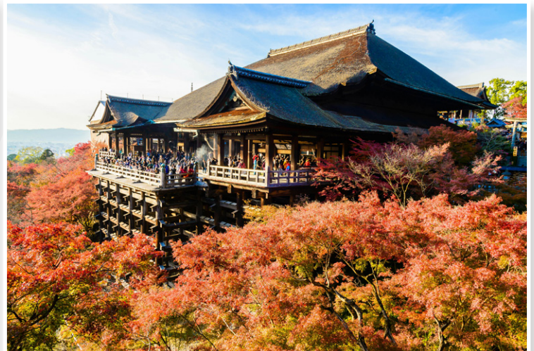
Kyoto - Kiyomizu-dera