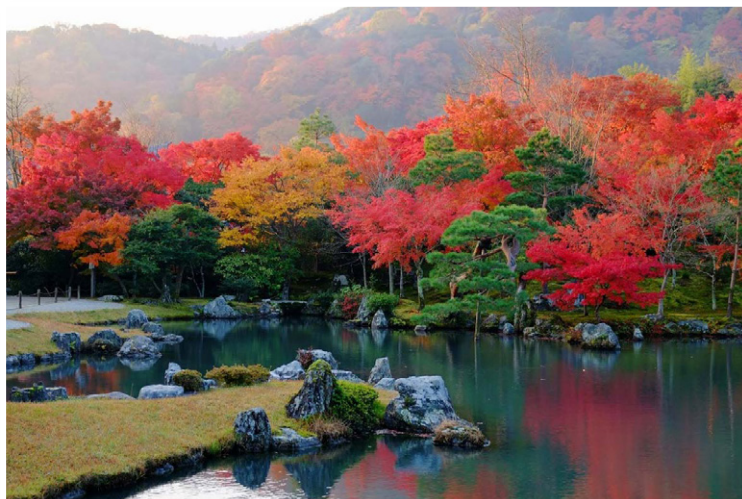
Arashiyama - Ο Zen κήπος του ναού Tenryu-ji