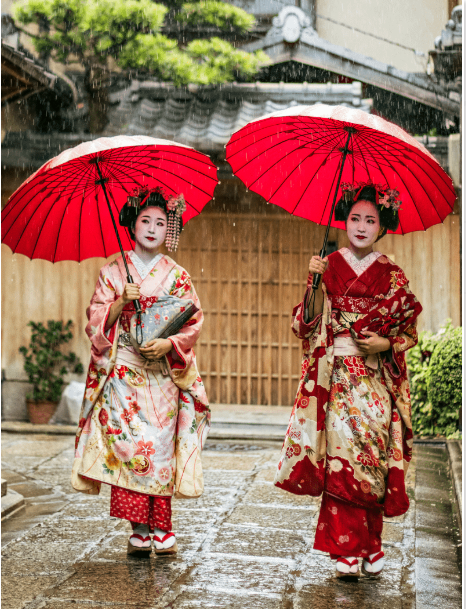
Κυото - Maiko στην περιοχή Gion