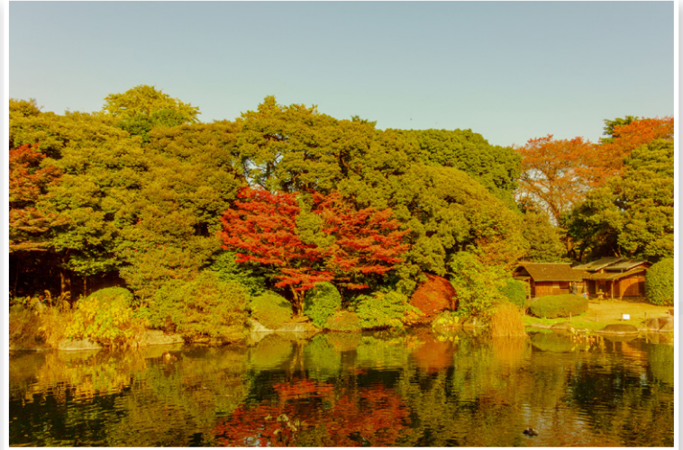
Τοκιο - Πάρκο Ueno