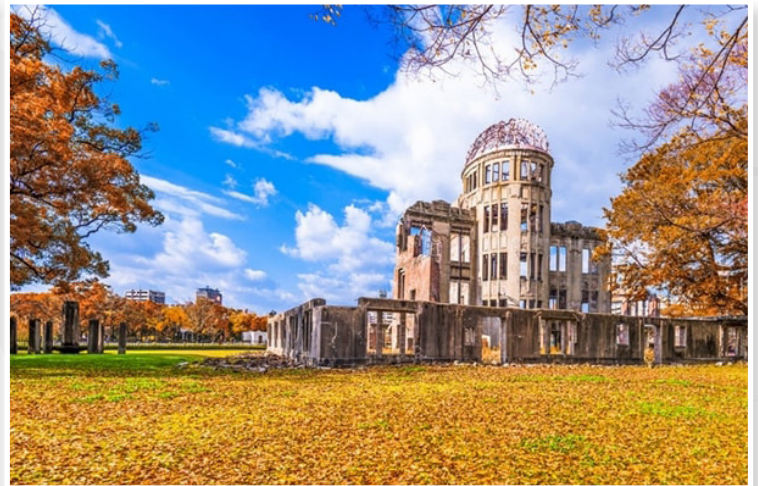
Hiroshima - Θόλος της Ατομικής Βόμβας