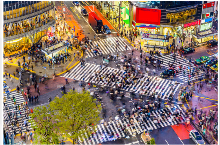
Τοκιο - Η διάσημη διάβαση της Shibuya