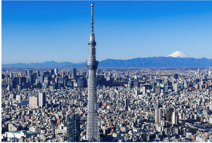
Tokyo - Tokyo Skytree