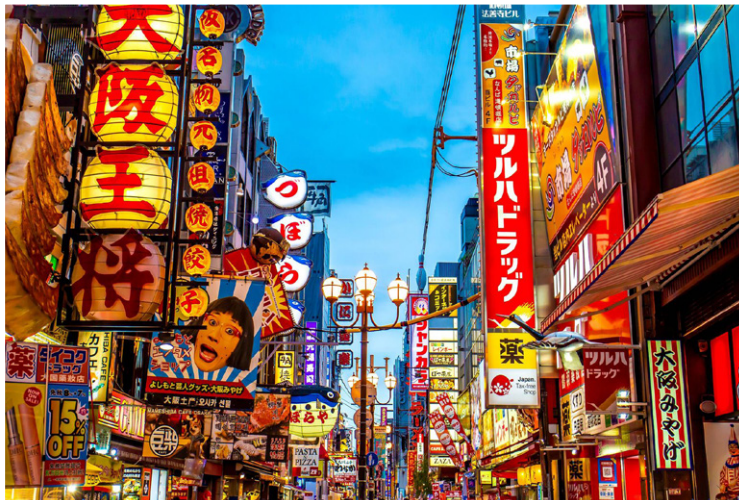
Osaka - Συνοικία Shinsaibashi