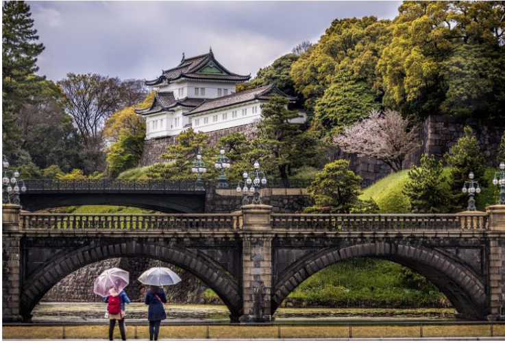
Τοκιο - Αυτοκρατορικό Παλάτι (Γέφυρα Nijubashi)