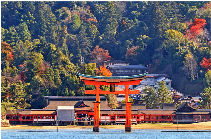
Miyajima - Ιερό Itsukushima