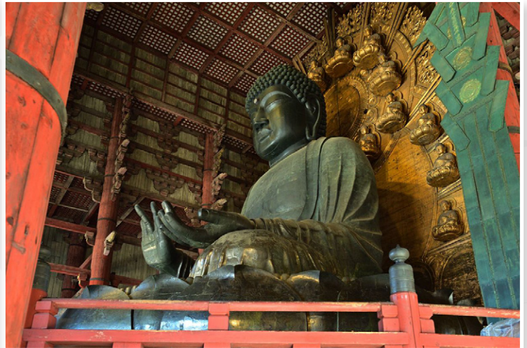
Nara - Ο Μεγάλος Βούδας (Ναός Todai-ji)