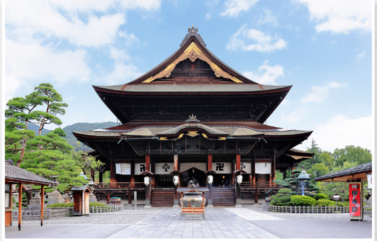
Nagano - Ναός Zenko-ji