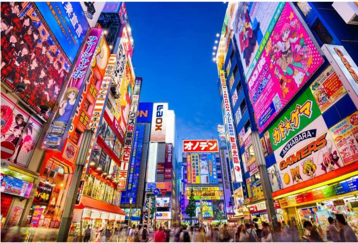
Τοκιο - Akihabara Electric Town