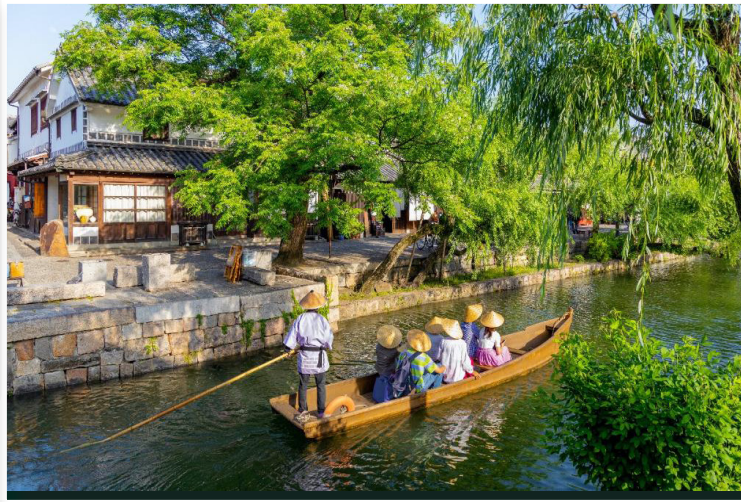
Kurashiki - Ιστορική περιοχή Bikan