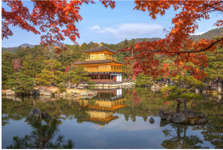
Kyoto - Kinkaku-ji (Χρυσό Περίπτερο)