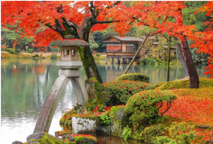
Kanazawa - Κήποι Kenrokuen