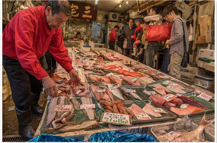
Tokyo - Αγορά Tsukiji