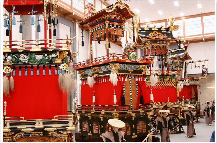
Takayama - Έκθεση Αρμάτων του Φεστιβάλ