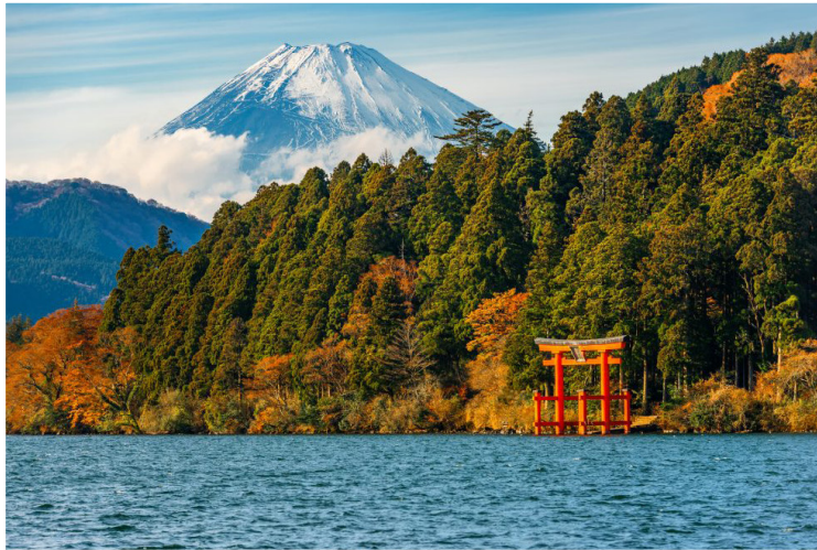
Hakone - Λίμνη Άσι &amp; Όρος Fuji