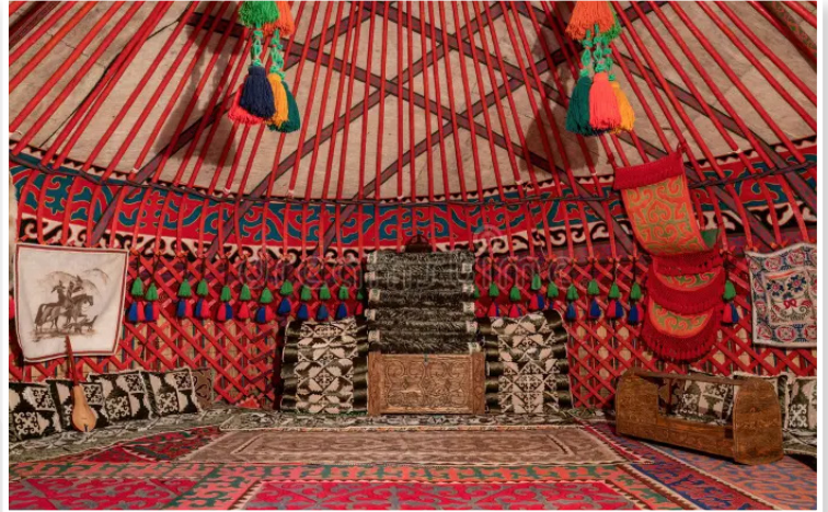
Παραδοσιακή γιούρτα (εσωτερικό)