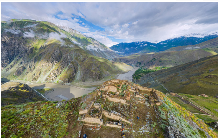
Αρχαιολογικός Χώρος Karon

Πρωινή αναχώρηση για το απομονωμένο χωριό Porshinev , ένα από τα πιο αυθεντικά και λιγότερο τουριστικά σημεία της περιοχής, όπου η ζωή παραμένει άρρηκτα συνδεδεμένη με τη φύση και τις τοπικές παραδόσεις. Εδώ επισκεπτόμαστε το Pir-i Shoh Nosir , ένα ιερό αφιερωμένο σε έναν Σούφι δάσκαλο, καθώς και μια ιερή πηγή που συνδέεται με τον Nosiry Khusrav , μια από τις σημαντικότερες μορφές της περιοχής, που διαμόρφωσε την πνευματική ταυτότητα των Pamir. Συνεχίζοντας τη διαδρομή προς το Kalai-Khum, το τοπίο γίνεται ολοένα πιο άγριο και επιβλητικό. Ψηλά πάνω από τον ποταμό, σε ένα σημείο που κόβει την ανάσα, εμφανίζεται το Karon , ένας από τους πιο εντυπωσιακούς αρχαιολογικούς χώρους του Τατζικιστάν, συχνά αποκαλούμενος το «Μάτσου Πίτσου των Pamir». Τα ερείπια αποκαλύπτουν έναν ολόκληρο χαμένο οικισμό: ακρόπολη, γήπεδο πόλο, ζωροαστρικούς ναούς και εγκαταστάσεις που μαρτυρούν τη σημασία του σημείου ως κόμβου πάνω στους αρχαίους δρόμους της περιοχής. Αφίξη στο Kalai Khum , έναν μικρό αλλά σημαντικό οικισμό που λειτουργεί ως βασικός σταθμός για όσους διασχίζουν το Pamir Highway. Κατά μήκος της διαδρομής, θα έχουμε την ευκαιρία να παρατηρήσουμε τη ζωή στις δύο πλευρές του ποταμού, με αφγανικά χωριά να διακρίνονται καθαρά απέναντί μας, προσφέροντας μια μοναδική εικόνα καθημερινότητας σε ένα από τα πιο ιδιαίτερα σύνορα του κόσμου.