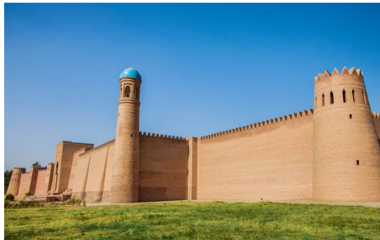
Porshinev - Αρχαιολογικός Χώρος Hulbuk

παρουσιάζονται ευρήματα που φωτίζουν την ιστορία και τον πολιτισμό της περιοχής. Κατά τη διάρκεια της διαδρομής μας προς την πρωτεύουσα, θα πραγματοποιήσουμε στάση στην περιοχή Nurek , ένα σημείο που αποκαλύπτει μια διαφορετική όψη της χώρας, συνδυάζοντας τη φυσική ομορφιά με τη σύγχρονη τεχνολογική παρέμβαση. Το Nurek είναι γνωστό για το εντυπωσιακό φράγμα του, ένα από τα υψηλότερα στον κόσμο, που δεσπόζει στο τοπίο και δημιουργεί μια τεχνητή λίμνη εξαιρετικής ομορφιάς, γνωστή ως «Τατζικική Θάλασσα». Τα τirkouάζ νερά της λίμνης, σε αντίθεση με τα γυμνά βουνά που την περιβάλλουν, δημιουργούν ένα σκηνικό ιδιαίτερα εντυπωσιακό και φωτογενές. Άφιξη στην Dushanbe , πρωτεύουσα του Τατζικιστάν, μια πόλη που συνδυάζει την ιστορία της Κεντρικής Ασίας με τον σύγχρονο αστικό ρυθμό. Χτισμένη σε μια εύφορη κοιλάδα και περιτριγυρισμένη από βουνά, αποτελεί το διοικητικό, πολιτιστικό και οικονομικό κέντρο της χώρας. Από έναν μικρό οικισμό πάνω σε εμπορικούς δρόμους, εξελίχθηκε κατά τη σοβιετική περίοδο σε οργανωμένη πόλη με φαρδιές λεωφόρους, πάρκα και δημόσια κτήρια. Σήμερα, η Dushanbe διατηρεί αυτόν τον χαρακτήρα, με ανοιχτούς χώρους, μνημεία και μια ήρεμη, ανθρώπινη καθημερινότητα.