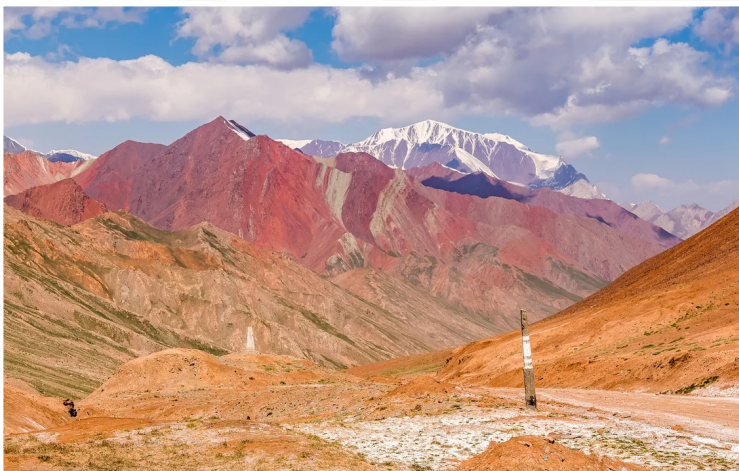
Kyzyl Art Pass (4.200μ.)