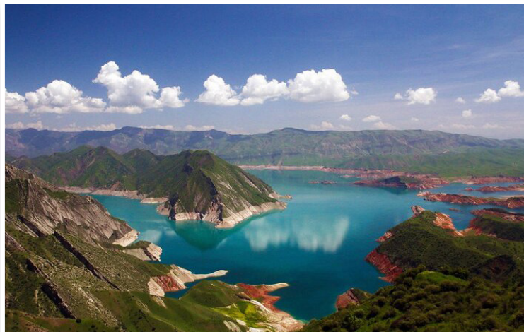
Τεχνητή Λίμνη Nurek