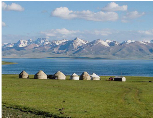
Λίμνη Song Kul (Κιργιστάν)