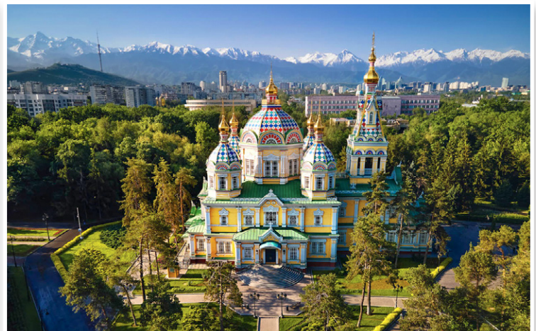
Almaty - Καθεδρικός Ναός Zenkov