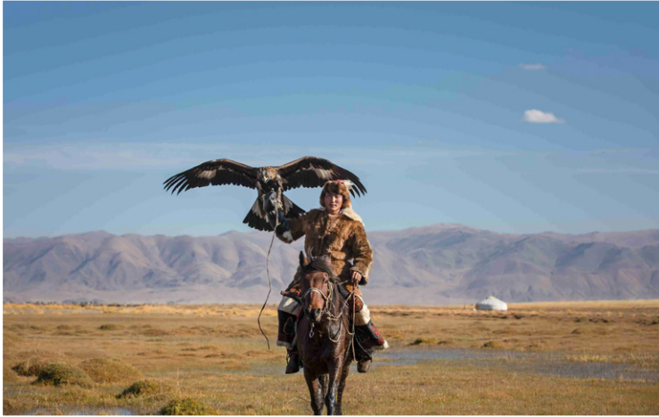
Παραδοσιακό Κυνήγι με αετό

Αναχωρούμε από το Karakol για να επισκεφθούμε την εντυπωσιακή κοιλάδα Jeti-Oguz , γνωστή για τους εμβληματικούς κόκκινους βράχους της, που ξεχωρίζουν μέσα στο καταπράσινο ορεινό τοπίο. Το όνομα «Jeti-Oguz» σημαίνει «Επτά Ταύροι» και αναφέρεται στους εντυπωσιακούς βραχώδεις σχηματισμούς, οι οποίοι θυμίζουν τη μορφή επτά ξαπλωμένων ταύρων. Στη συνέχεια θα κατευθυνθούμε προς το χωριό Kadzhi Sai , ακολουθώντας μια διαδρομή κατά μήκος της νότιας όχθης της λίμνης Issyk-Kul, που αποκαλύπτει την ιδιαίτερη γεωμορφολογία της περιοχής, όπου οι ορεινοί όγκοι της οροσειράς Tian Shan κατεβαίνουν ομαλά προς τη λίμνη. Στη διαδρομή θα κάνουμε στάση για πεζοπορία στο Skazka Canyon (Φαράγγι της Παραμυθένιας Ιστορίας), ένα εντυπωσιακό, μικρό φαράγγι στη νότια όχθη της λίμνης, που ξεχωρίζει για τους ζωηρούς κόκκινους, πορτοκαλί και κίτρινους σχηματισμούς από άργιλο και ψαμμίτη που θυμίζουν κάστρα, δράκους και ζώα. Μια εύκολη πεζοπορία μέσα στο φαράγγι προσφέρει πανοραμική θέα της μπλε λίμνης Issyk-Kul, δημιουργώντας έντονη χρωματική αντίθεση. Η ημέρα μας θα κλείσει στην όχθη της λίμνης όπου θα διανυκτερεύσουμε σε παραδοσιακό καταυλισμό με γιούρτες .