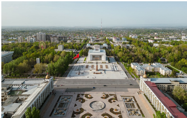
Bishkek - Πλατεία Ala Too

Μετά το πρωινό, αναχωρούμε από τη λίμνη Song Kul και κατευθυνόμαστε προς την πρωτεύουσα του Κιργιστάν, Bishkek , ακολουθώντας μια εντυπωσιακή ορεινή διαδρομή που σταδιακά μας οδηγεί από το απομονωμένο αλπικό τοπίο σε πιο κατοικημένες περιοχές. Στη διαδρομή, εκτός από τα μοναδικά τοπία, θα θαυμάσουμε τον ιδιαίτερο Πύργο Burana , έναν ιστορικό μιναρέ του 11ου αιώνα στην κοιλάδα Chuy. Αποτελεί απομεινάρια της αρχαίας πόλης Balasagun των Καραχανιδών και ένα από τα παλαιότερα αρχιτεκτονικά μνημεία στην Κεντρική Ασία. Άφιξη στην Bishkek αργά το απόγευμα και δειπνο σε επιλεγμένο τοπικό εστιατόριο με φολκλορική παράσταση , που μας εισάγει στην παραδοσιακή μουσική και κουλτούρα της χώρας.