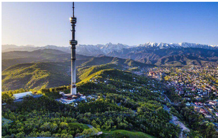
Almaty - Λόφος Kok-Tobe

Η ημέρα μας είναι αφιερωμένη στο Αλμάτι , την παλιά πρωτεύουσα και πιο κοσμοπολίτικη πόλη του Καζακστάν, η οποία απλώνεται στους πρόποδες της επιβλητικής οροσειράς Tian Shan, δημιουργώντας έναν μοναδικό συνδυασμό αστικού τοπίου και άγριας φύσης. Ξεκινάμε την περιήγησή μας από το κέντρο της πόλης, όπου θα γνωρίσουμε τα πιο χαρακτηριστικά σημεία αναφοράς, όπως την Πλατεία της Δημοκρατίας και το Πάρκο των 28 Φρουρών του Παναφίλοφ , ένα από τα πιο ιστορικά και συμβολικά σημεία της πόλης. Εκεί βρίσκεται και ο εντυπωσιακός Καθεδρικός Ναός Zenkov , ένα από τα υψηλότερα ξύλινα κτήρια στον κόσμο, κτισμένο χωρίς τη χρήση καρφιών, που αποτελεί χαρακτηριστικό