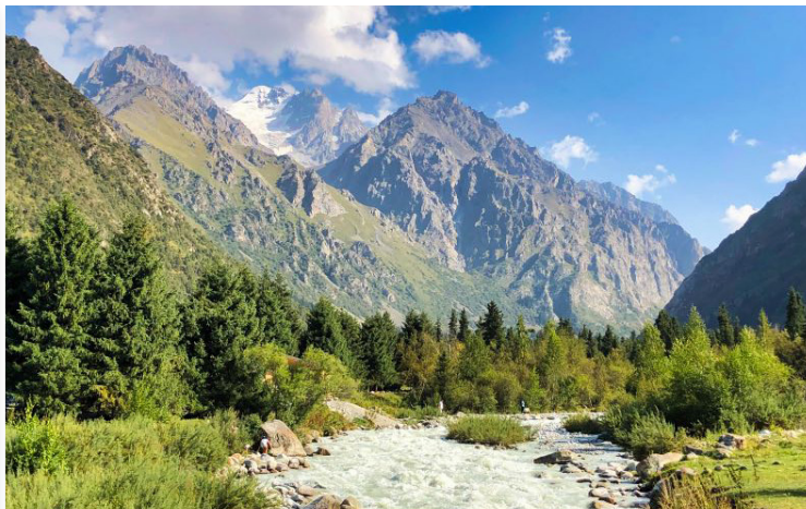
Εθνικό Πάρκο Ala Archa