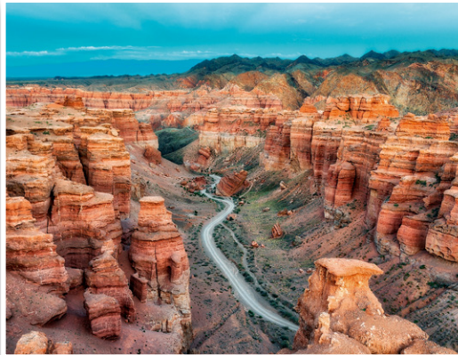
Φαράγγι Charyn (Καζακστάν)