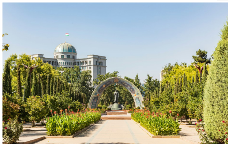
Dushanbe - Πάρκο Rudaki