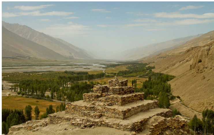
Ερείπια βουδιστικής στούπας στο Vrang

Πρωινή αναχώρηση για το εντυπωσιακό φρούριο Yamchun , ένα από τα σημαντικότερα ιστορικά μνημεία της κοιλιάδας Wakhan , που δεσπόζει σε στρατηγική θέση πάνω από τον ποταμό Panj . Το φρούριο χρονολογείται σε προϊσλαμικούς χρόνους και αποτελούσε σημαντικό οχυρό του Δρόμου του Μεταξιού, ελέγχοντας τις εμπορικές και στρατιωτικές διαδρομές που διέσχιζαν την περιοχή. Δεν θα παραλείψουμε να κάνουμε μια στάση στην παρακείμενη θερμή πηγή Bibi Fatima για να απολαύσουμε μερικές στιγμές χαλάρωσης. Στη συνέχεια θα επισκεφθούμε το χωριό Yamg , τόπο καταγωγής του σουφί Muboraki Vakhoni , σημαντικού Ισμαηλίτη φιλοσόφου, ποιητή, μουσικού και αστρονόμου. Ξενάγηση στο σπίτι του, το οποίο πλέον λειτουργεί ως λαογραφικό μουσείο . Εδώ θα έχουμε την ευκαιρία να μάθουμε περισσότερα για την μουσική παράδοση της περιοχής και ειδικότερα για το tubab , ένα παραδοσιακό, έγχορδο, μουσικό όργανο με ρίζες στην Κεντρική Ασία, το οποίο αποτελεί και το εθνικό όργανο του Αφγανιστάν. Συνεχίζουμε για το χωριό Vrang , που είναι γνωστό για το αρχαίο βουδιστικό του συγκρότημα, το οποίο βρίσκεται σε υπερυψωμένη θέση πάνω από το χωριό και αποτελεί ένα από τα σημαντικότερα κατάλοιπα της βουδιστικής παρουσίας στην Κεντρική Ασία. Τα ερείπια του μοναστηριού και των स्तουπών μαρτυρούν την εποχή που η περιοχή αποτελούσε σημείο συνάντησης θρησκειών και πολιτισμών κατά μήκος του Δρόμου του Μεταξιού.