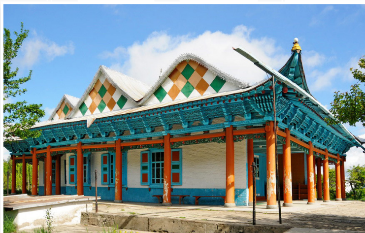
Karakol - Τζαμί των Ντουγκάνων