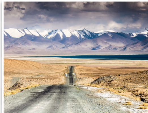
Αυτοκινητόδρομος Pamir (Τατζικιστάν)

Σχεδιάσαμε ένα εκτενές και πολυδιάστατο ταξίδι 23 ημερών για να γνωρίσουμε σε βάθος τρεις από τις πιο αυθεντικές και λιγότερο εξερευνημένες χώρες της Κεντρικής Ασίας – το Καζακστάν , το Κιργιστάν και το Τατζικιστάν . Πρόκειται για ένα ιδιαίτερο οδοιπορικό, το οποίο συνδυάζει σύγχρονες πόλεις με εντυπωσιακή αρχιτεκτονική, μοναδικά φυσικά τοπία μεγάλης ποικιλομορφίας ( στεπες, κοιλάδες, φαράγγια, πεδιάδες, υψίπεδα και αλπικά τοπία ), καθώς και ουσιαστική επαφή με τις παραδόσεις και τον τρόπο ζωής των νομαδικών λαών της περιοχής, προσφέροντας μια ολοκληρωμένη εικόνα της γεωγραφικής και πολιτιστικής ταυτότητας της Κεντρικής Ασίας.