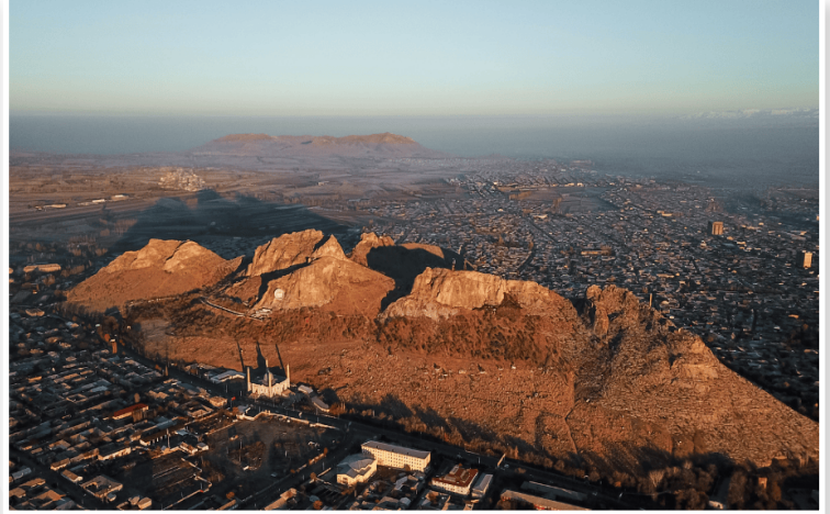
Osh - Ιερό Βουνό Sulaiman-Too