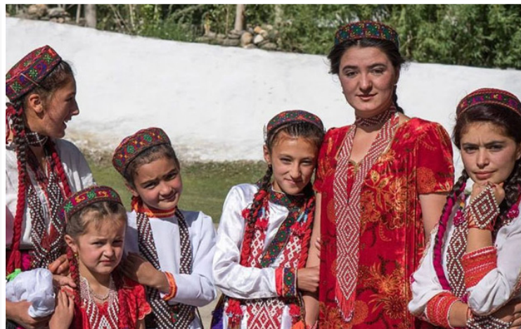
Τατζίκι με παραδοσιακές στολές από την Κοιλιάδα Wakhan