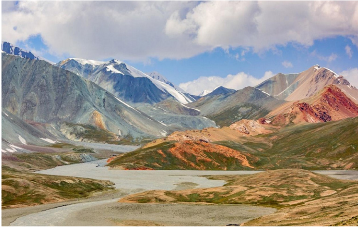
Ο ποταμός Panj

Η ημέρα μας είναι αφιερωμένη στο Khorog , την απομονωμένη πρωτεύουσα των Pamir, χτισμένη σε ένα εντυπωσιακό σημείο στις όχθες του ποταμού Panj . Θα ανέβουμε στον Βοτανικό Κήπο της Khorog , έναν από τους υψηλότερους στον κόσμο, από όπου η θέα ανοίγεται σε όλη την κοιλάδα. Συνεχίζουμε με μια σύντομη στάση στο Μουσείο της πόλης όπου παρουσιάζονται στοιχεία της ιστορίας και του πολιτισμού των Pamir, και θα ακολουθήσει περίπατος στο κεντρικό πάρκο της πόλης για να εστιάσουμε σε αυτό που κάνει την περιοχή ξεχωριστή: τους ανθρώπους της. Οι κάτοικοι του Badakhshan διατηρούν έναν ιδιαίτερο τρόπο ζωής και μια ξεχωριστή πολιτιστική ταυτότητα, που παραμένει ζωντανή μέσα στον χρόνο. Η εμπειρία κορυφώνεται με επίσκεψη σε ένα παραδοσιακό παμίρικο σπίτι , το οποίο αποτελεί έναν μοναδικό τύπο κατοικίας, πλήρως προσαρμοσμένο στις δύσκολες συνθήκες της περιοχής. Η αρχιτεκτονική του βασίζεται σε έναν ιδιαίτερο συμβολισμό, με τα πέντε κύρια δομικά στοιχεία να συνδέονται με την ισμαηλιτική παράδοση. Ο εσωτερικός χώρος οργανώνεται γύρω από ένα κεντρικό άνοιγμα στην οροφή, που επιτρέπει το φως να εισέρχεται, δημιουργώντας μια ζεστή και προστατευμένη ατμόσφαιρα. Περισσότερο από μια απλή κατοικία, αποτελεί ζωντανή έκφραση της κουλτούρας και της καθημερινότητας των κατοίκων. Επίσης, θα έχουμε την ευκαιρία να δούμε την κατασκευή τοπικών χειροτεχνημάτων και να έρθουμε σε άμεση επαφή με έναν τρόπο ζωής που παραμένει αυθεντικός και ανεπηρέαστος.