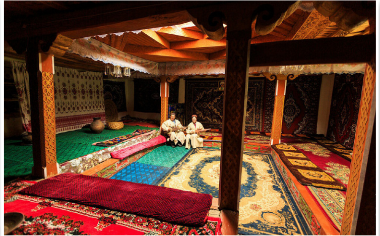
Παραδοσιακό παμίρικο σπίτι