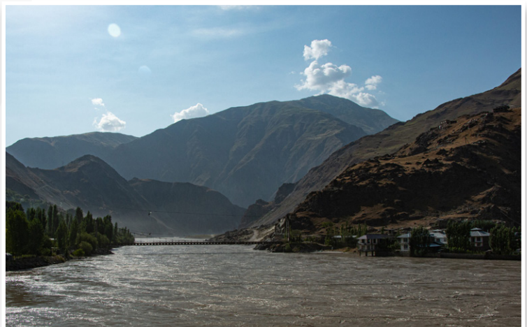
Γέφυρα στον ποταμό Pyandzh μεταξύ Τατζικιστάν - Αφγανιστάν (Kalai Khum)